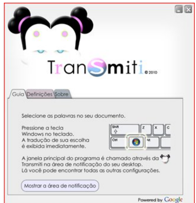
Figura 1: Tela inicial do Transmiti.