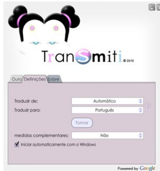
Figura 2: Tela de Definições.

Para configurar o programa clique em Definições , veja Figura 2.